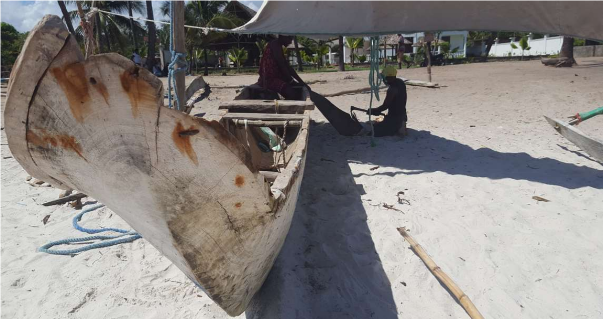
Kiga Bay - 2016.2019