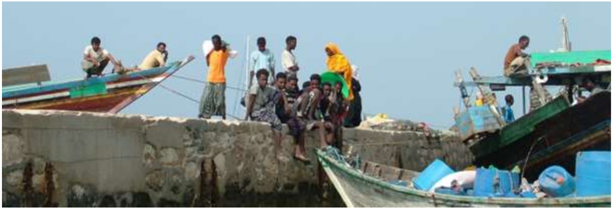
Isola Grand Dahlak 2009