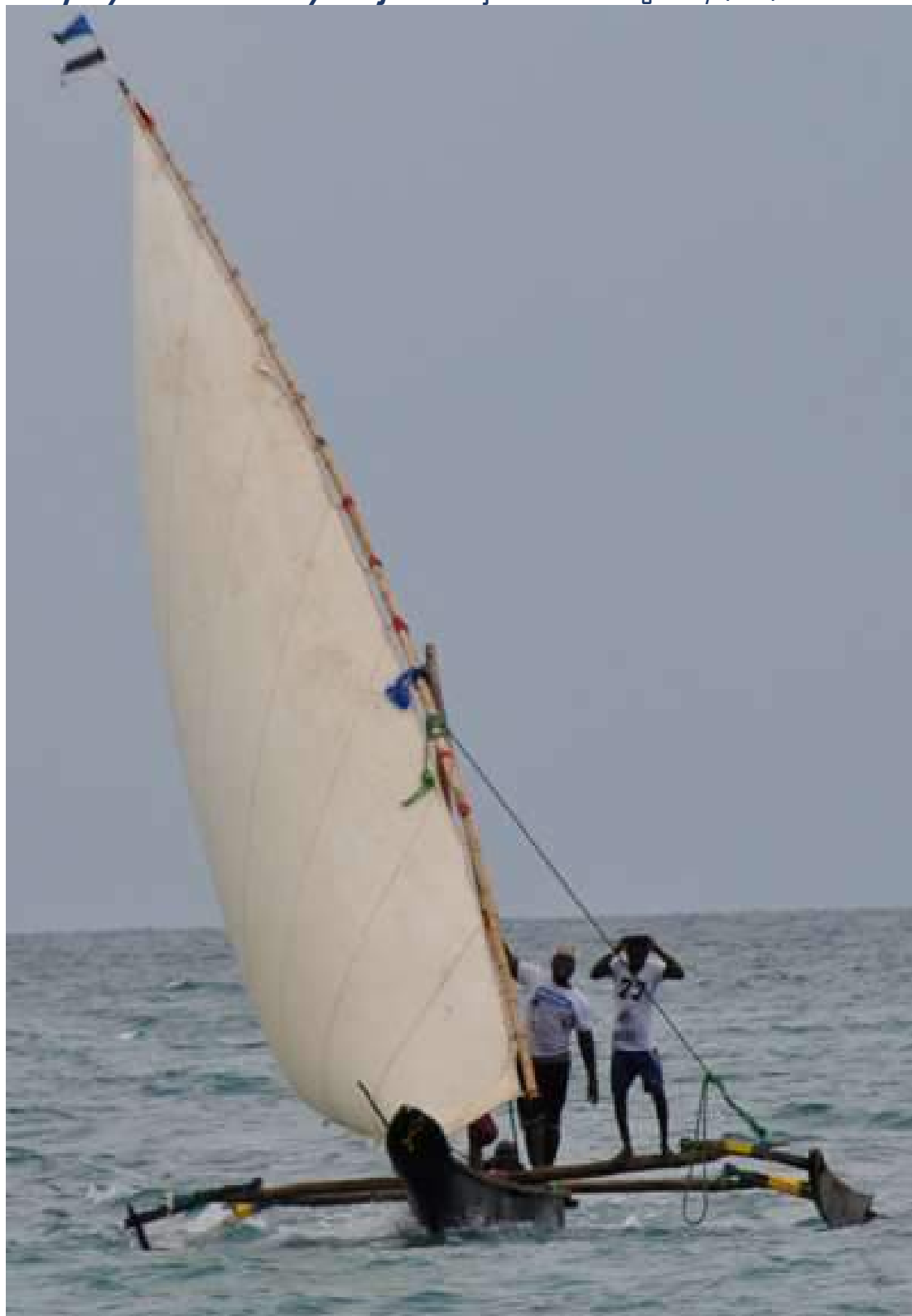
Ngalawa Sophia - Kiga Bay 2017 l'ammiraglia dopo il restauro.

Stop Dynamite Fishery Project – Mjimwema - Kiga Bay (Dar) 2016-2023