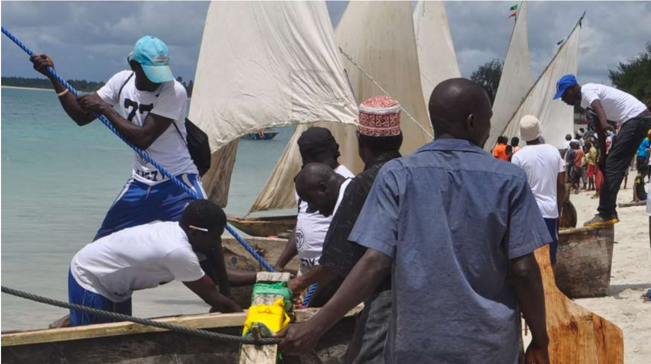
Kiga Bay Dar 2017