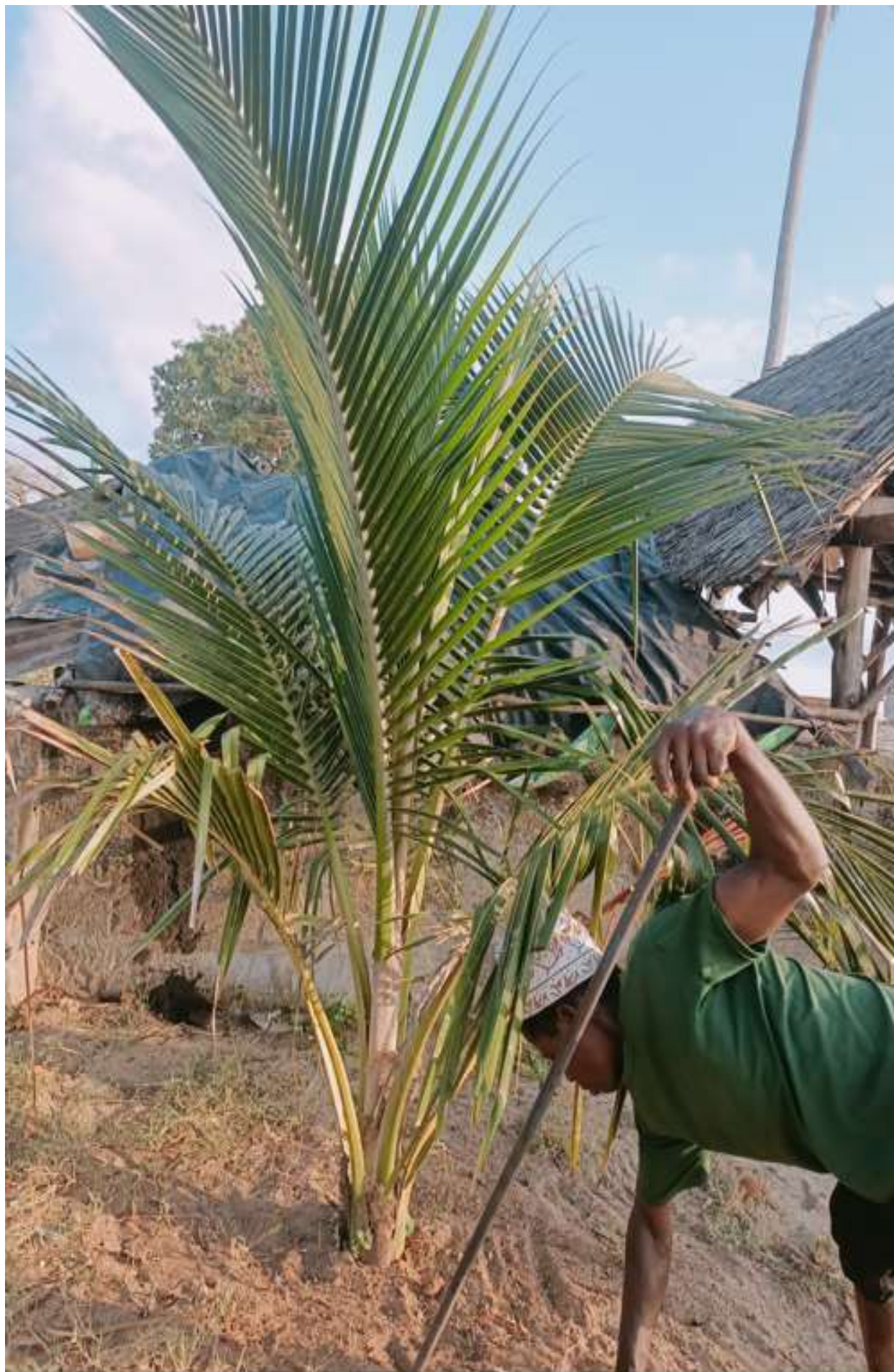
Mjimwema 2019 in progress