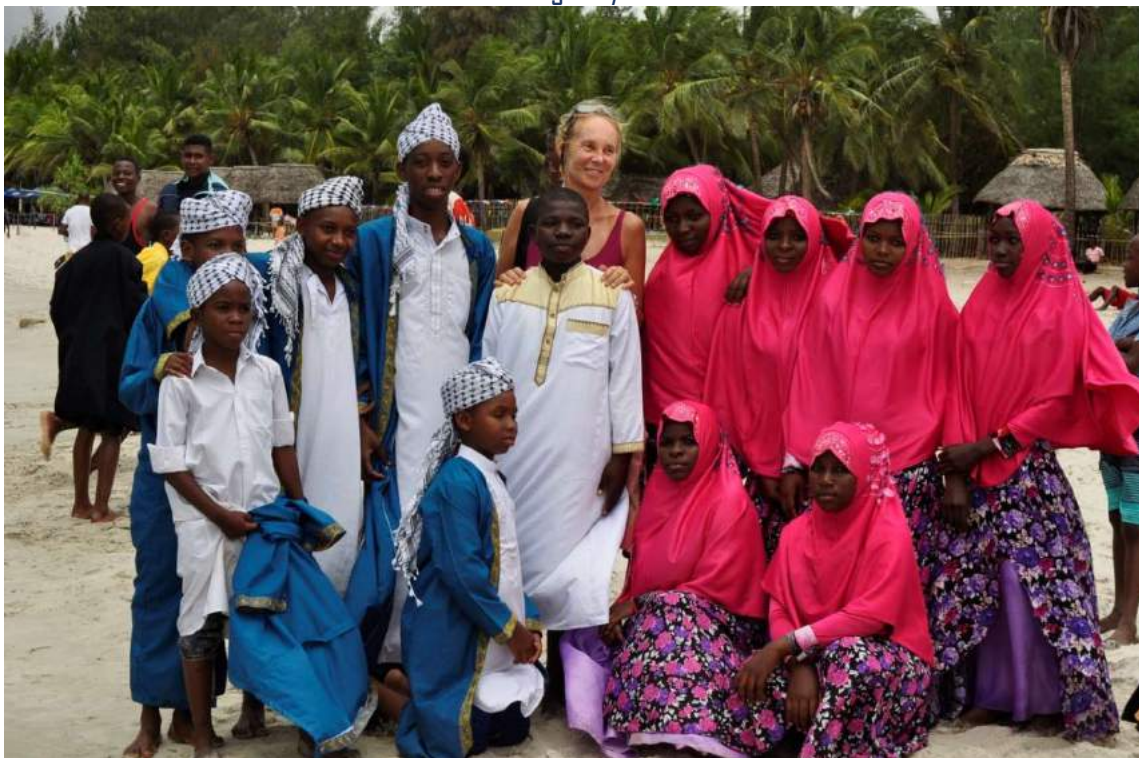
La festa per il bando gov. contro la pesca di frodo con Dinamite (by VPM e MFCCG) 2017