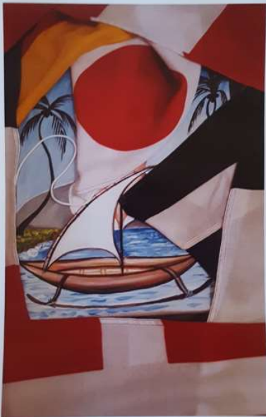
BMU - Fishermen Association & VPM