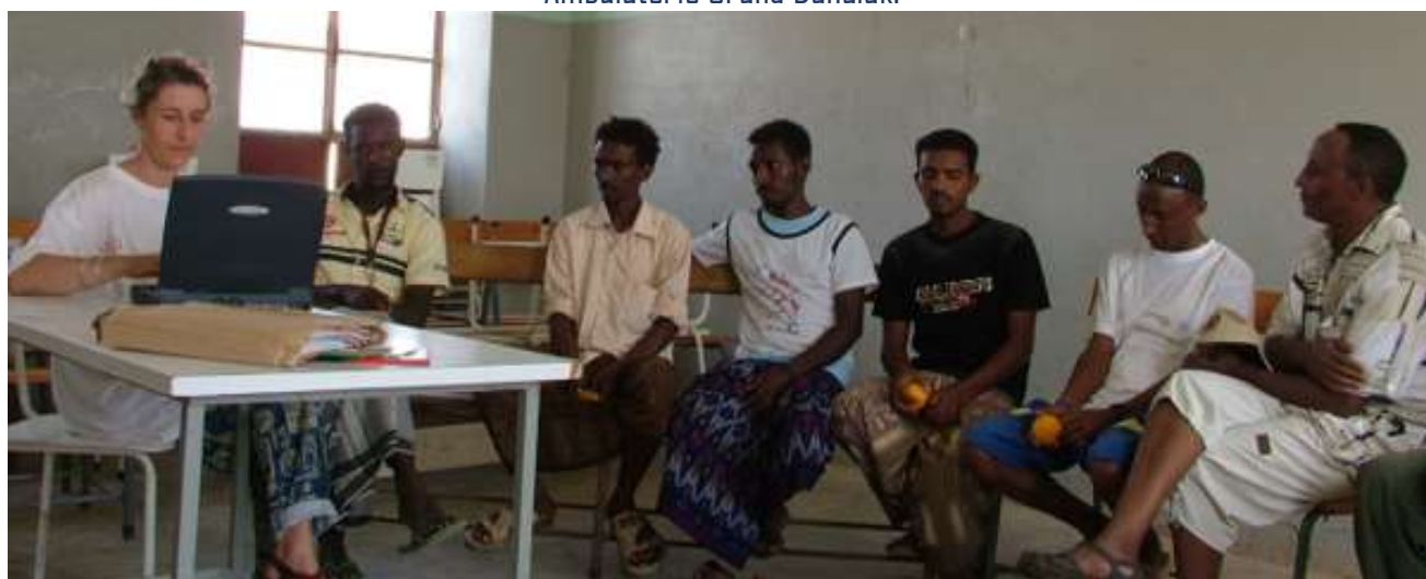
Formazione ai giovani infermieri locali e comunitaria