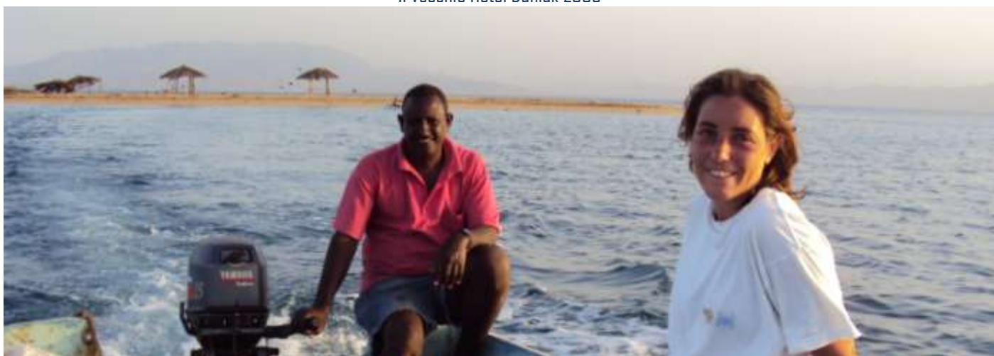
Green Island - past-President VPM Igiea Lanza d.S. - 2010