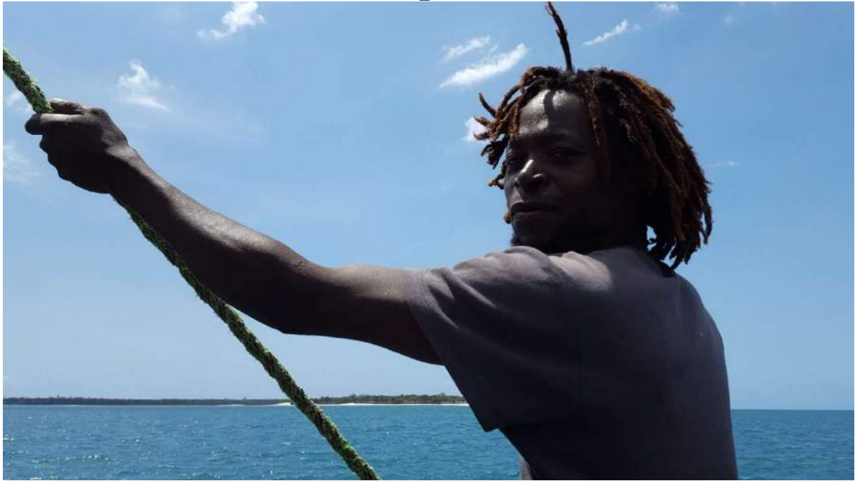
Mwanamalundi - prodiere e bro scomparso in mare nel 2020