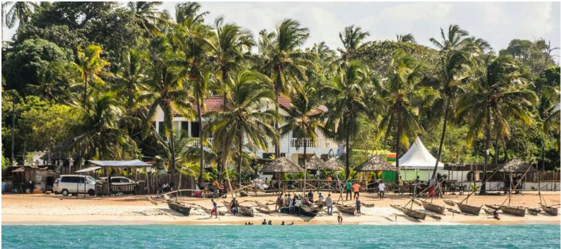
HQ VPM - KigaBay 2016-2019