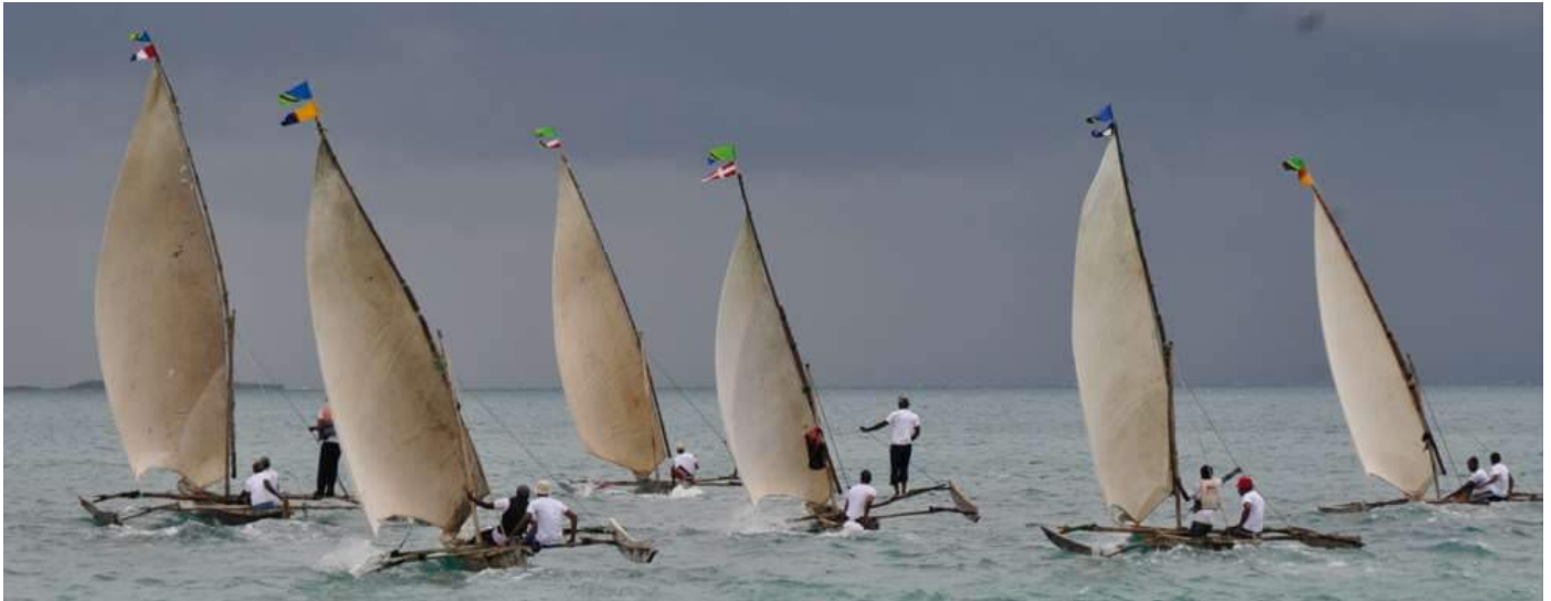
The Round Sinda "stop dynamite" Race KigaBay - August 19-20/2017