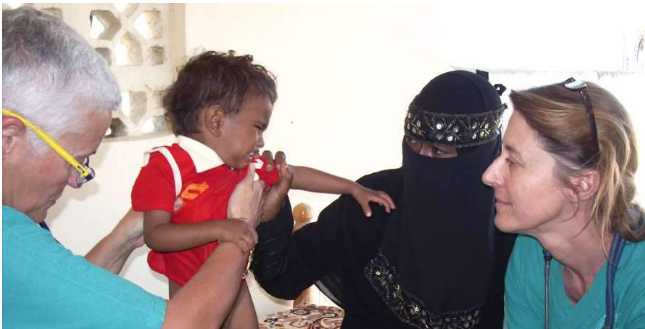
Ambulatorio Grand Dahalak: