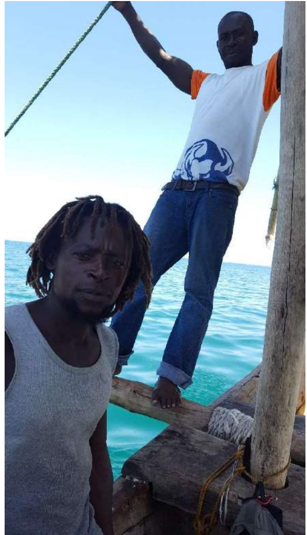
Attività 3 - Eco-Eventi a Sinda Island (Area Marina Protetta) 2017-2018