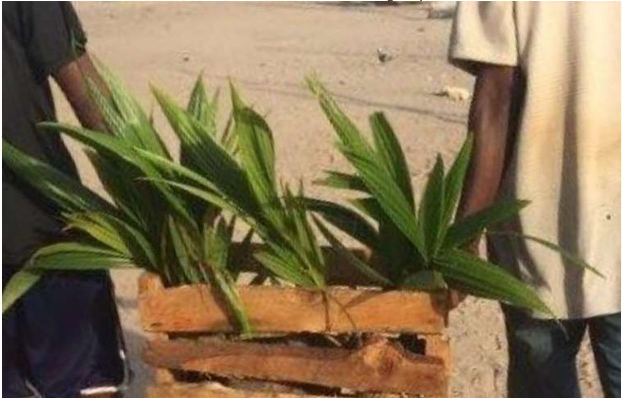
nuove piantumazioni di palma da cocco con costante annaffio nel tempo 2017